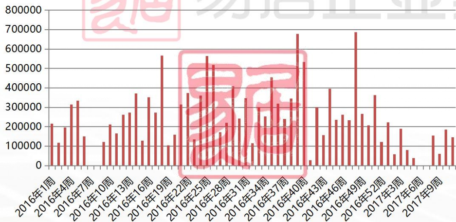
佛山商品住宅周度新增预售面积走势