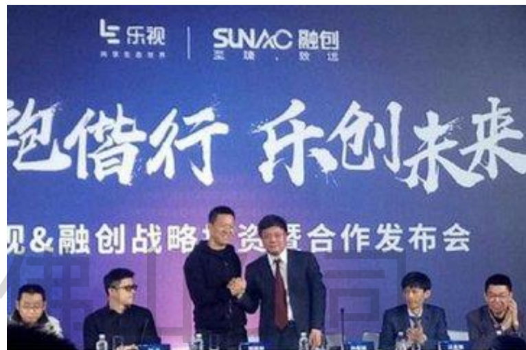
融创中国入股乐视估值汇总

点评：融创的进入解决了乐视目前的资金问题，而号称“并购之王”的融创投资乐视，也是在为互联网和地产的整合布局。