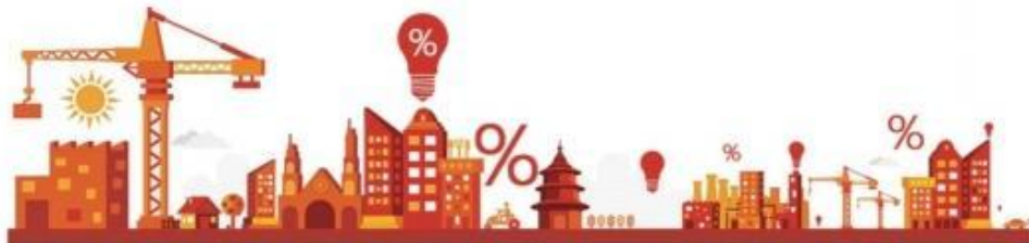
珠三角首套房房贷平均利率对比

一季度过半，不少购房者正紧盯节后房贷市场。对比珠三角8城主要商业银行首套房贷款利率显示，惠州房贷利率均值最高，已接近基准利率（4.9%）。据融360统计，中国银行等9家银行首套房利率上调至4.9%；而广州、珠海房贷利率均值在8城中最低，均为4.19%，折扣均值8.6折。其中，珠海有18家银行提供按揭贷款，截至上周末，只有渣打银行首套房贷款利率上浮到9折，17家银行仍能提供8.5折优惠。