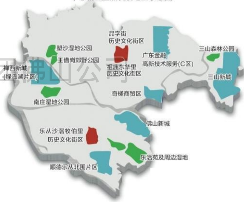
中心城区重点发展地区示意图

《“十三五”近规》按照佛山市城镇空间发展结构，将近期市级重点发展地区分为近期重点开发建设地区、重点更新改善地区和重点生态保育地区。其中，禅西新城、佛山西站枢纽片区、三山新城、佛山新城、西江新城和三水新城为近期划定的6处重点开发建设地区。目前佛山人口规模为846万人，到2020年，佛山市总人口规模控制为910万人。