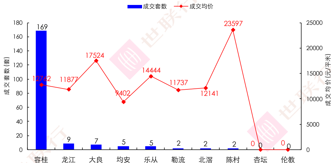
2017年第33周顺德各镇街一手住宅成交情况