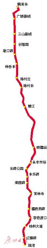
佛山地铁 11 号线站点