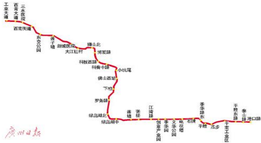
佛山地铁 4 号线一期

走向和初步的站点设置。另据了解，由于佛山地铁 4 号线季华园站被设计为一般站而非换乘站，而且与广佛线的季华园站相距较远，两条线实现同站换乘有一定难度。