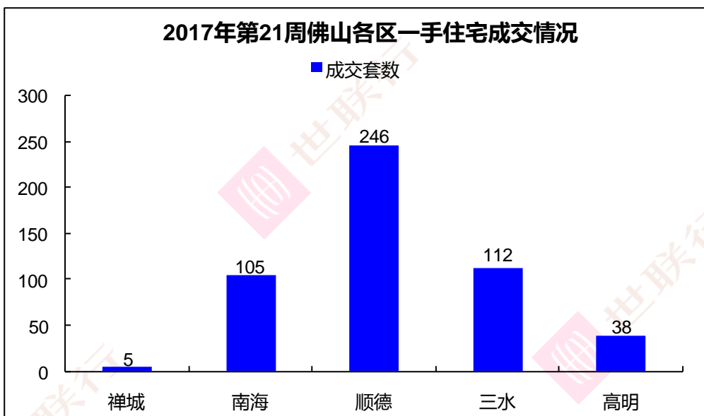
【数据来源：世联数据平台】

从上周各区成交数据来看，禅城共成交 5 套，环比减少 55.6%，南海区共成交 105 套，环比增长 87.5%，顺德共成交 246 套，环比减少 47.8%，三水共成交 112 套，环比增长 80.6%，高明共成交 38 套，较前周持平。