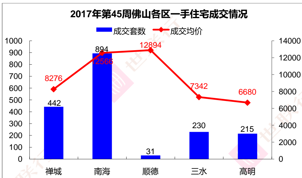
【数据来源：世联数据平台】

从第45周各区成交数据来看,禅城成交442套,环比减少41.1%,成交均价8276元/平米,环比下跌37.0%;南海区共成交894套,环比减少40.4%,成交均价12566元/平米,环比上升4.6%;顺德共成交31套,环比下降57.5%,成交均价12894元/平米,环比上升9.7%;三水共成交230套,环比减少60.7%,成交均价7342元/平米,环比下跌9.6%;高明共成交215套,环比上升182.9%,成交均价6680元/平米,环比上升7.6%。