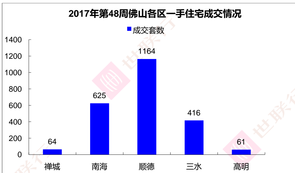
【数据来源：世联数据平台】

从第48周各区成交数据来看，本周顺德区成为成交量之首，共成交1164套，占总成交的接近五成，主要是美的领衔公馆，还有碧桂园在顺德的几个项目集中签约，支撑起整区成交；而禅城区和高明区本周仅成交60余套，环比下降了62.1%和51.2%，而三水区成交与上周基本持平，而南海区成交也上升，环比上升了112.6%，较前一周多成交331套。