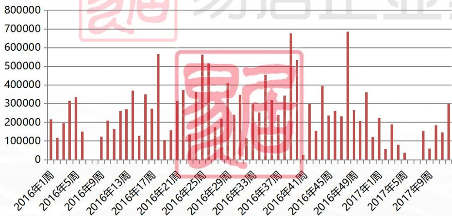
佛山商品住宅周度新增预售面积走势