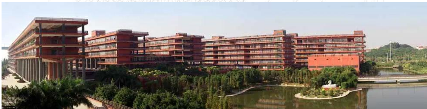
广州美术学院。

依托佛山高新区科技产业园，建设国际化开放性艺术与文化创意区，将佛山校区打造成地标性当代文化与城市生活的创新典范，建设新的城市文化核心；以佛山校区为中心，辐射周边佛山高新区禅城园，引领促进周边企业转型升级。